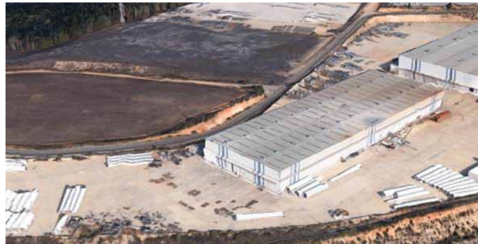
Internacional Berciana de Montaje, la mayor empresa de ingeniería, fabricación y montaje de estructuras metálicas para grandes obras en España.